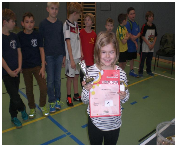
34. Minimeisterschaften 2016 - Ortsausscheid Schwerin

Die Zielsetzungen des TTVMV in den nächsten Jahren lauten: